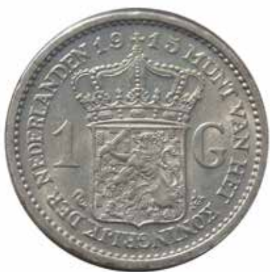
Gulden uit 1915